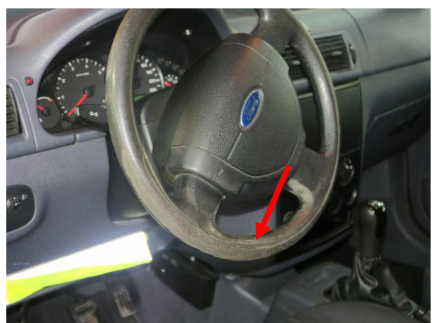
Radia brak, Obicie tapicerskie kierownicy obtarte.